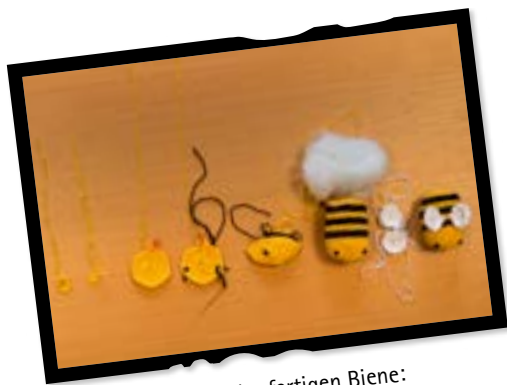
Größe der fertigen Biene: 7 cm lang, 5 cm im Durchmesser